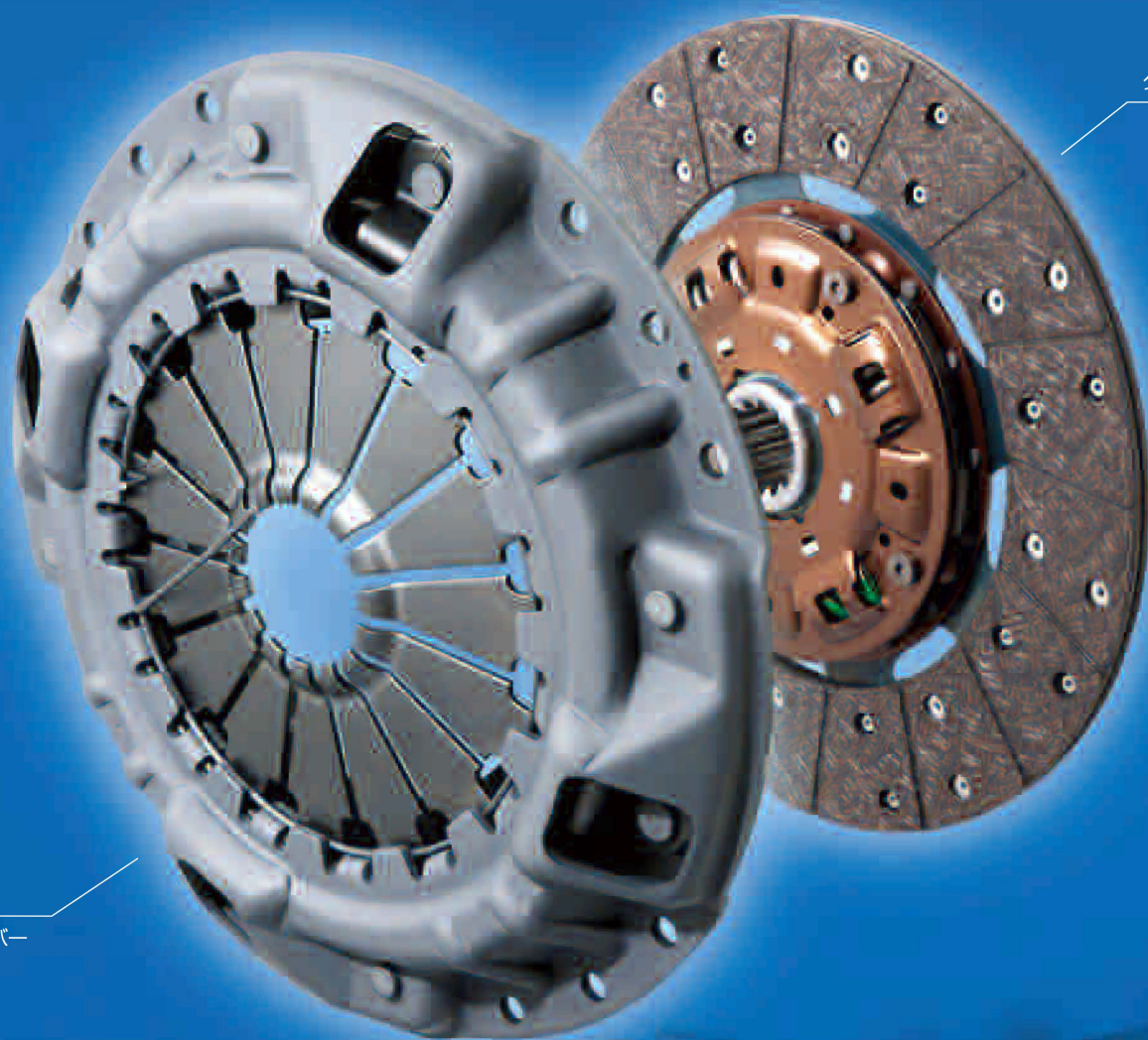
クラッチディスク