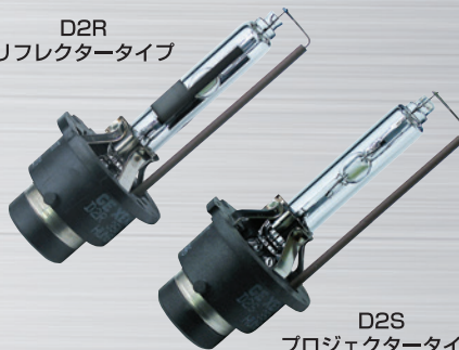
D2S プロジェクタータイプ